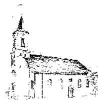
St. Antonius, Schönwald

Dienstag 15:00 Uhr – 18:00 Uhr Donnerstag 09:00 Uhr – 11:30 Uhr