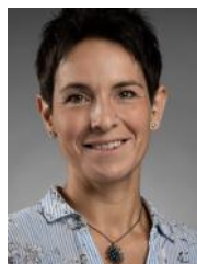
Manuela Banic Bürgerbüro Einwohnermeldeamt Renten- u. Sozialangelegenheiten Terminvergabe für Rentenberatung Schülerbeförderung

Zimmer Erdgeschoss Nr. 1 Telefon 07722 8608-25 monika.ganter@schoenwald.de